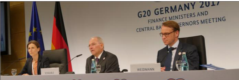
وزیران مالی بیست قدرت اقتصادی جهان موسوم به «جی ۲۰» شامگاه روز شنبه نشست دو روزه خود را در شهر بادن-بادن آلمان بدون کلامی نتیجه ای در زمینه تجارت آزاد و تغییرات اقلیمی به پایان رساندند. در پی سرسختی مقامات آمریکا به رهبری

ستینو موجین، وزیر خزانه داری این کشور، وزیران مالی به «گروه ۲۰» در بیانیه نهایی خود از موضع گذشتگی خود مبنی بر ارتقای تجارت آزاد و مقابله کامل با نظام «حفاظت» یا «پروتکشنیزم» در اقتصاد عقب نشینی کردند. در عوض، وزیران بیانیه ای را منتشر کردند که در آن بیشتر بازی کلامی دیده می شود. در این بیانیه گفته شده است که کشورها «برای تقویت گسترش تجارت در کشورهای خود کار می کنند». تعهدات برای سیستم های تجاری چندجانبه از جمله «سازمان تجارت جهانی» نیز به طور آشکارا از نشست نادیده گرفته شد. (دوپیچه وله)