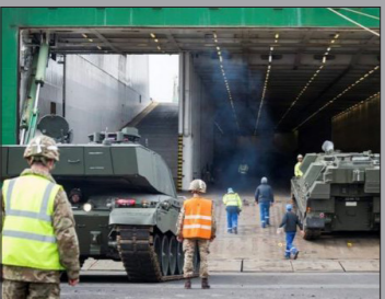
وزیر دفاع بریتانیا همچنین گفت که استقرار این نیروها ضروری است و افزود «ما شاهد افزایش ستیزه جویی های روسیه بوده ایم و نیاز داریم که به متحدان خود در مرزهای شرقی اطمینان خاطر بدهیم.» (بی بی سی)

نخستین گروه ۸۰۰ نفره از نیروهای بریتانیایی برای تقویت توان دفاعی ناتو در منطقه بالتیک وارد استونیا شدند. به گفته وزیر دفاع بریتانیا این کشور نقش عمده ای در تقویت نیروهای ناتو در مرزهای شرقی به عهده گرفته است. به دنبال الحاق کریمیه در خاک اوکراین به روسیه تنش بین دو کشور افزایش پیدا کرد. مایکل فالون، وزیر دفاع بریتانیا به خبرنگار بی بی سی گفت که این بزرگترین عملیات استقرار نیروی نظامی بریتانیا در اروپا از زمان جنگ سرد تاکنون و نشان دهنده تعهد کشورش به جلوگیری از تهدیدات روسیه است.