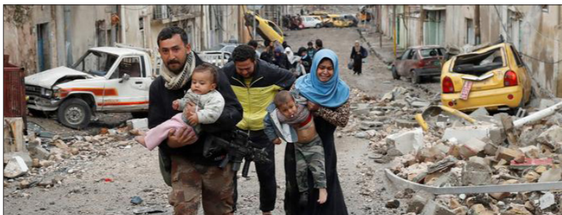
نبرد در مناطقی از شهر موصل که توسط گروه شبه نظامی تروریستی «دولت اسلامی» اشغال گردیده است. همچنان ادامه دارد. اردوی عراق جنگ های شدید خانه به خانه در بخش قدیمی این دومین شهر بزرگ را انتظار دارد. یک ماه پس از شروع حملات تهاجمی برای پس گرفتن بخش غربی موصل، نیروهای عراقی در بخش قدیمی این شهر در حال پیشروی هستند. بر اساس معلومات اردوی عراق، از جمله یک مسجد و دو بازار تحت کنترل این نیروها در آمده اند.

بنابراین واحدهای ویژه در ۸۰۰ متری مسجد النوری قرار دارند. این مسجد یک هدف نمادین مهم است. ابوبکر البغدادی، رهبر گروه تروریستی «دولت اسلامی» یا داعش در جولای سال ۲۰۱۴ در اینجا، «خلافت» خود را در بخش هایی از عراق و سوریه اعلام کرد. اردوی عراق برای یک جنگ طولانی خانه به خانه علیه جهادبست ها در بخش های شهر قدیمی موصل آمادگی دارد. شرایط به دلیل کوچک های تنگ و نزدیکی خانه ها به خصوص دشوار است. فراس الزاویدی، سخنگوی واحد