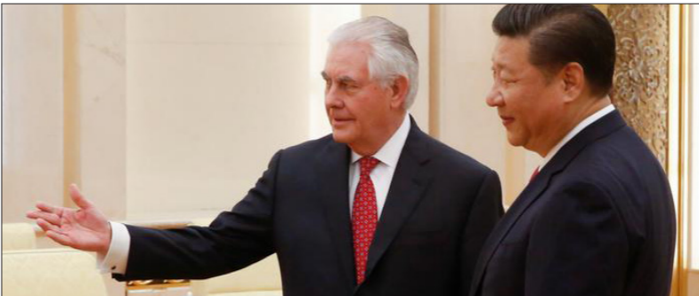
سفر ریس تیلرسون وزیر خارجه ایالات متحده آمریکا به چین، برای واشنگتن اهمیت بزرگی دارد. هر دو کشور می خواهند روابطشان را تقویت کنند، اما آنها در مورد تایوان و کوریای شمالی سیاست های متفاوتی دارند.

شی جین پینگ رئیس جمهور چین در تلاش همکاری نزدیکتر میان دو کشور هستند. تیلرسون در مرحله پایانی سفر آسیایی اش در پکنینگ گفت که هدف، رسیدن به تفاهم بزرگتر است. «طوری که به تقویت روابط میان چین و ایالات متحده آمریکا رهنمون شود». شی جین پینگ رئیس جمهور چین گفت که او اطمینان دارد که رابطه دوجانبه میان دو کشور «در مسیر درست» رشد خواهد کرد. باوجود آن در ارتباط با کمک های نظامی آمریکا به تایوان میان هر دو جانب بی اعتمادی عمیقی وجود دارد؛ این مساله به چگونگی جهت گیری سیاست ایالات متحده آمریکا در آینده نیز مرتبط است. (دوپیچه وله)