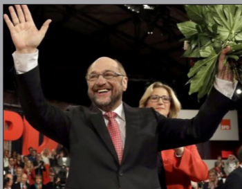
مارتین شولتس، دبیر حزب سوسیال دموکرات آلمان، در جریان سخنرانی خود در این نشست، شدت از رجب طیب اردوغان، رئیس جمهور ترکیه انتقاد کرد و گفت که اجازه نخواهد داد آقای اردوغان با تفرقه افکنی در بین ترک های آلمان برای همه پرسوی ماه آینده در ترکیه رای جمع کند. او همچنین شدیداً به آقای اردوغان حمله کرد که دولت های آلمان و هلند را به نازی ها تشبیه کرده بود. (بی بی سی)

حزب چپ میانه سوسیال دموکرات دبروز (۱۹ مارچ، ۲۹حوت) نشست یک روزه ویسژای در برلین برگزار کرد و در آن مارتین شولتس را به اتفاق آرا به رهبری برگزید. آقای شولتس در سخنرانی خود در این نشست، شدت از رجب طیب اردوغان، رئیس جمهور ترکیه انتقاد کرد و گفت که اجازه نخواهد داد آقای اردوغان با تفرقه افکنی در بین ترک های آلمان برای همه پرسوی ماه آینده در ترکیه رای جمع کند. او همچنین شدیداً به آقای اردوغان حمله کرد که دولت های آلمان و هلند را به نازی ها تشبیه کرده بود. (بی بی سی)