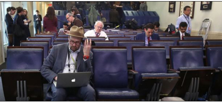
ممنوعیت حضور نمایندگان برخی رسانه‌ها در نشست خبری غیررسمی اخیر کاخ سفید، واکنش تند رسانه‌ها را به دنبال آورد. (بی بی سی)

و بی‌پس‌ی از مقامات کاخ سفید خواسته تا درباره این ممنوعیت توضیح دهند. روز جمعه، ۲۴ فبروری، گزارش شد که کاخ سفید نمایندگان تعدادی از رسانه‌های جریان اصلی را از حضور در یک نشست خبری غیررسمی منع کرده است. بی‌بی‌سی، سی‌ان‌ان، نیویورک تایمز، گاردین، لس‌آنجلس تایمز، بازفید، دلیلی‌میل و پولیتیکو از جمله این رسانه‌ها هستند. گزارش شده است که به آسوشیته‌پرس، یواس‌ای‌تودی و مجله تایم اجازه داده شده بود که در این جلسه شرکت کنند. ولی خبرنگاران آنها در اعتراض به محدود کردن گروهی از خبرنگاران حاضر نشده‌اند به محل جلسه بروند. (بی بی سی)