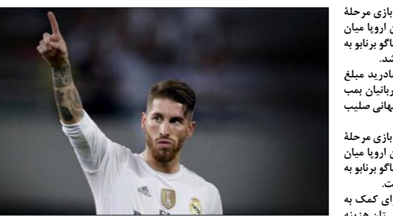
راموس در این باره گفت: «برای ما افتخار بزرگی است که بتوانیم در چنین کمک‌هایی سهمیم. ما با کمک می‌کنیم تا بتوانیم به بهبود زندگی نیازمندان کمک کنیم.»

چک این پول امشب پیش از بازی مرحله یک هشتم نهایی لیگ قهرمانان اروپا میان رئال مادرید و ناپولی درسانتیاگو برنابو به نمایندگی از یوفا داده خواهد شد. سرجیو راموس، کاپیتان رئال مادرید مبلغ یک صد هزار یورو برای قربانیان بمب گذاری در افغانستان به کمیته جهانی صلیب سرخ کمک کرد. چک این پول دینیب پیش از بازی مرحله یک هشتم نهایی لیگ قهرمانان اروپا میان رئال مادرید و ناپولی درسانتیاگو برنابو به نمایندگی از یوفا داده شده است. گفته می‌شود که این مبلغ برای کمک به قربانیان بمب گذاری در افغانستان هزینه خواهد شد. راموس که در نظرسنجی بهترین بازیکنان سال ۲۰۱۶ یوفا از کاربران بیشترین رأی را از آن خود کرده بود به نمایندگی از یوفا این چک را به صلیب سرخ اهدا می‌کند.