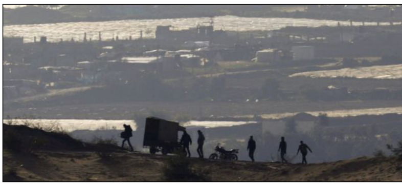
دو کشور مستقل را به عنوان یکی از راه‌حل‌های کلیدی برای برقراری صلح بین اسرائیل و فلسطینیان دنبال کرده است. (بی بی سی)