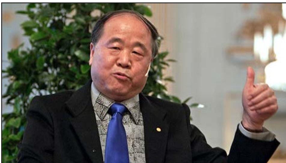
«مو یان» نویسنده چینی برنده نوبل ادبیات اعلام کرد در حال نوشتن یک رمان جدید است و هنوز رویای

خلق آثار ادبی بزرگ را در سر می‌پرورانند. شینهاو نوشت: «مو یان» نویسنده چینی که در سال ۲۰۱۲ جایزه نوبل ادبیات را از آن خود کرد، در حال نگارش اولین اثر خود پس از کسب مهم‌ترین جایزه ادبی جهان است. این نویسنده همچنین اعلام کرد کتاب جدیدش حول محور موضوعات تاریخی و معاصر نوشته می‌شود و درباره سرایان، تکنسین‌ها، کودکان و صنعتگران است. «یان» این خبر را همزمان با رونمایی نسخه‌های جدید ۱۱ رمان قبلی خود در یکین اعلام کرد. «ذرت سرخ» و «بقه‌ها» از جمله رمان‌های او هستند که با ظاهری جدید دوباره وارد بازار کتاب چین شده‌اند. این آثار همچنین به زبان‌های انگلیسی، فرانسوی، سوئدی، اسپانیولی، آلمانی، ایتالیایی و جاپانی ترجمه شده‌اند. برنده نوبل ادبیات ۲۰۱۲ در این مراسم با بیان این‌که فرآیند نوشتن آزمون پشتکار، توانایی و انرژی برای نویسنده است، گفت: میلی درونی مرا به سمت بهتر نوشتن سوق می‌دهد. می‌خواهم چیزی بنویسم که به عنوان یک اثر کلاسیک در دنیای ادبیات شناخته شود.