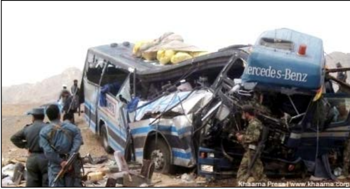
Khaama Press | www.khaama.org

ترافیکی باید شرکت های مسافری را مجبور بسازد تا در مسیرهای طولانی دو راننده را همزمان برای رانندگی یک موتر استفاده کند تا از این طریق رویدادهای ترافیکی اندکی کاهش یابد.