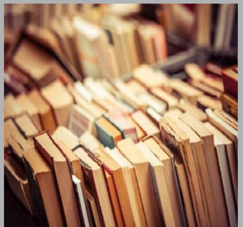
است و «وود» برای نگارش «The Natural Way of Things» به این جایزه ۴۰ هزار دلاری دست پیدا کرده است.

جایزه ۸۰ هزار دلاری سه بخش از جوایز نخست‌وزیر استرالیا، بین دو نویسنده تقسیم شد. «گاردین» نوشت: جوایز نخست‌وزیر استرالیا که عنوان گران‌قیمت‌ترین جایزه ادبی این کشور را یدک می‌کشد، در بخش‌های ادبیات داستانی، غیرداستانی، تاریخ، شعر و ادبیات کودک و نوجوان به آثار برگزیده «لیزا گورتون» و «شارولت وود» در این دوره به عنوان برندگان مشترک جایزه بخش ادبیات داستانی معرفی شدند. «زندگی خانه‌ها» نام رمان برگزیده «گورتون» است و «وود» برای نگارش «The Natural Way of Things» به این جایزه ۴۰ هزار دلاری دست پیدا کرده است.