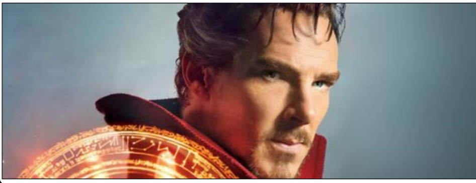
فلم ابرقهرمانی «داکتر استرنج» در اولین هفته نمایش بین‌المللی به فروش چشمگیر ۸۶ میلیون دلاری دست یافت.

بیش از «نگهبانان کهکشان» و همچنین ۲۳ درصد بالاتر از فروش آغازین «کاپیتان آمریکا: سرباز زمستانی» است و با توجه به این که «داکتر استرنج» در مقایسه با دیگر شخصیت‌های داستان‌های مصور مارول کمتر شناخته شده است، این میزان فروش اولیه بسیار قابل توجه است. «داکتر استرنج» به کارگردانی «اسکات دریکسون» و با نقش آفرینی «بندیکت کامبریج» در نقش اصلی در آخر هفته میلادی که گذشت اکران خود را در کشورهای چون فرانسه، بریتانیا، ایتالیا، آلمان، مکزیک، کوریا و هانگ کانگ آغاز کرد و در همه این بازارها در صدر گیشه فروش قرار گرفت. فلم ابرقهرمانی «داکتر استرنج» در اولین هفته نمایش بین‌المللی به فروش چشمگیر ۸۶ میلیون دلاری دست یافت. به نقل از واریتی، «داکتر استرنج» که جدیدترین فلم از محصولات استودیو مارول کمپانی دیزنی است یک هفته پیش از اکران در سینماهای آمریکا در گیشه بین‌الملل به روی پرده رفت است. در اولین هفته نمایش خود در ۳۳ کشور، فروش ۸۶ میلیون دلاری را رقم زد. فروش آغازین ۸۶ میلیون دلاری «داکتر استرنج» که چهاردهمین فلم در دنیای مارول محسوب می‌شود، حدود ۵۰ درصد از فروش «مرد مورچه‌ای»، ۲۷ درصد