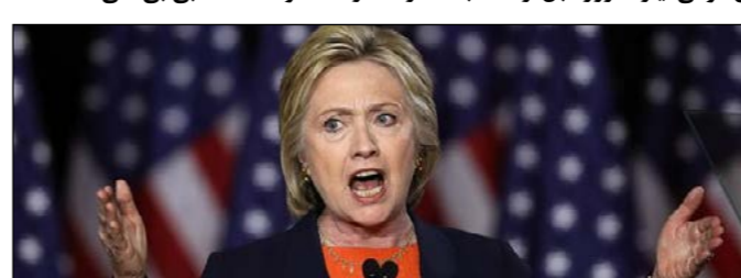
هیلاری کلینتون، نامزد حزب دموکرات آمریکا در انتخابات ریاست‌جمهوری از اف‌بی‌آی (پلیس فدرال آمریکا) خواسته تا جزئیات کاملی در باره ایمیل‌های جدیدی که ممکن است به تحقیقات مربوط به استفاده او از ایمیل شخصی در دوران وزارت امور خارجه مربوط باشد را منتشر کند. خانم کلینتون ابراز اطمینان کرده که تحقیق جدید اف‌بی‌آی از این ایمیل‌ها، یافته‌های پیشین این سازمان را که گفته بود خانم کلینتون کاری خلاف قانون نکرده، نقض نخواهد کرد. خانم کلینتون خواهان آن شده که جیمز کومی، رئیس اف‌بی‌آی در باره نامه خود به کنگره آمریکا توضیح بیشتری دهد. آقای کومی، یازده روز قبل از انتخابات، در