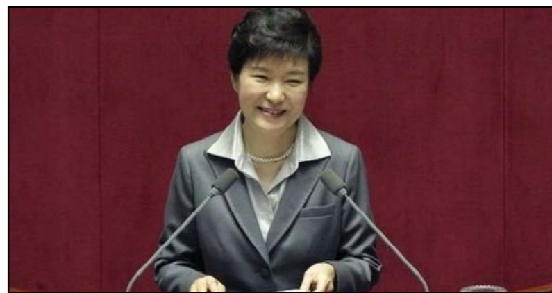
پارک گئون هئی، رئیس‌جمهوری کوریای جنوبی به ده مشاور ارشد خود دستور داده تا از سمت خود کناره‌گیری کنند. درخواست برای استعفای این افراد پس از آن صورت می‌گیرد که رئیس‌جمهوری کوریای جنوبی پذیرفت که به یکی از دوستان خود اجازه تا از سمت خود کناره‌گیری کند. درخواست برای استعفای این افراد پس از آن صورت سیاسی‌اش را ویرایش کند.

گزارش شده که چوی سون سیل که هیچ سمت دولتی ندارد، در امر سیاست‌گذاری دخالت کرده و به واسطه ارتباطش با رئیس‌جمهوری، نفع مالی هم برده است. طی روزهای گذشته تحقیقات قضایی در این مورد گسترش یافته و پولیس دفاتر چوی سون سیل و چند نفر دیگر را بازرسی کرده است. رئیس‌جمهوری کوریای جنوبی در نطق تلویزیونی هفته پیش خود از مردم کشورش به این خاطر عذرخواست: اما این عذرخواهی باعث نشد تا اتهام‌های سوء مدیریت متوجه او نشود. قرار است یک تظاهرات بزرگ ضد دولتی در سئول، پایتخت کوریای جنوبی برگزار شود. انتخابات سراسری کوریای جنوبی سال آینده برگزار می‌شود و این مساله به محبوبیت او به شدت لطمه زده است. حزب مخالف «عدالت» خواهان کناره‌گیری خانم پارک از قدرت شده است. (بی بی سی)