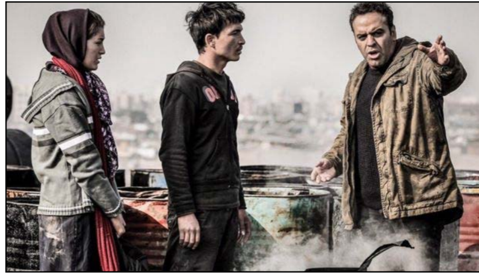
جنجال به زمانی بر می گردد که عده ای از دست اندر کاران سینما در نخستین فرصت فلم «رفتن» را مانند فلم «چند متر مکعب عشق» محصولی از سینمای افغانستان نپذیرفتند. به باور آنها این فلم‌ها سبک سینمای ایران را منعکس می‌کنند، هر دو در ایران صحنه برداری شده‌اند و پس از آن به افغانستان فرستاده شدند.

پناهجویی به عنوان یک بحث مهم و خبرساز عصر ما شکل گرفته، به ویژه برای آنانی که طعم تلخ آن را چشیده‌اند. سیر حرکت پناهجویان با هیجان همراه است. تصمیم مهم عجولانه گرفته می‌شوند و برنامه‌ها هر لحظه در حال تغییر اند. فلم «رفتن» در کنار داستان عشقی به این همه سرگذشت‌ها منصفانه پرداخته و ماجرا و حقایق ناگوار پناهنده‌ها را به تصویر کشیده است. فلم «رفتن» به عنوان نماینده افغانستان به بخش فلم‌های خارجی‌زبان اسکار معرفی شده بود اما بعد از فهرست نهایی فلم‌های راه یافته به اسکار حذف شد. نوید محمودی، کارگردان این فلم در گفت‌وگو با بی‌بی‌سی در مورد دلیل راه نیافتن «رفتن» به فهرست نهایی اسکار گفت: «یک تن از فلم‌سازان افغان به کمیته گزینش اسکار به شرایط فلم رفتن اعتراض کرده. به دلیل اینکه چرا فلم خودش به اسکار معرفی نشده است.»