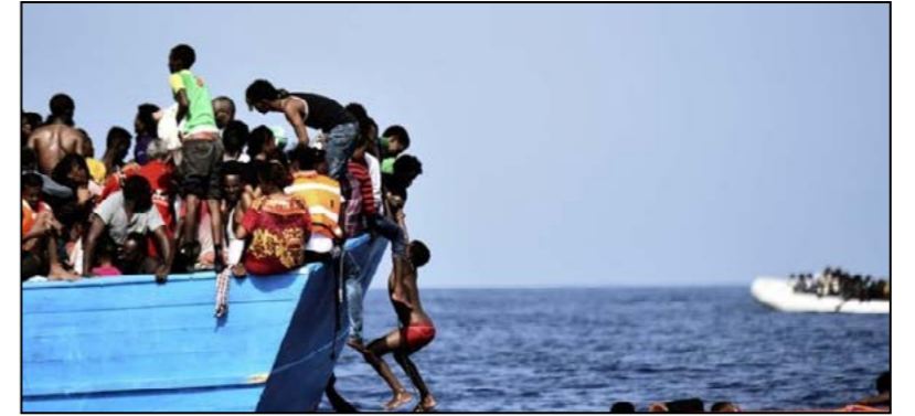
کمیساریای عالی پناهندگان سازمان ملل می‌گوید که در طول سال جاری میلادی تا کنون بیش از سه هزار نفر از مهاجرانی که تلاش می‌کردند با عبور از دریای مدیترانه خود را به اروپا برسانند، در این دریا غرق شده‌اند

داشته است و هنوز دو ماه تا پایان سال باقی مانده است.