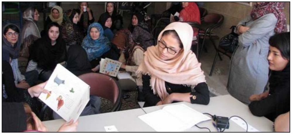
برنامه ترویج کتابخوانی در قالب طرح «با من بخوان» برای ۴۰۰ کودک در شهر مزارشریف افغانستان اجرا می‌شود.