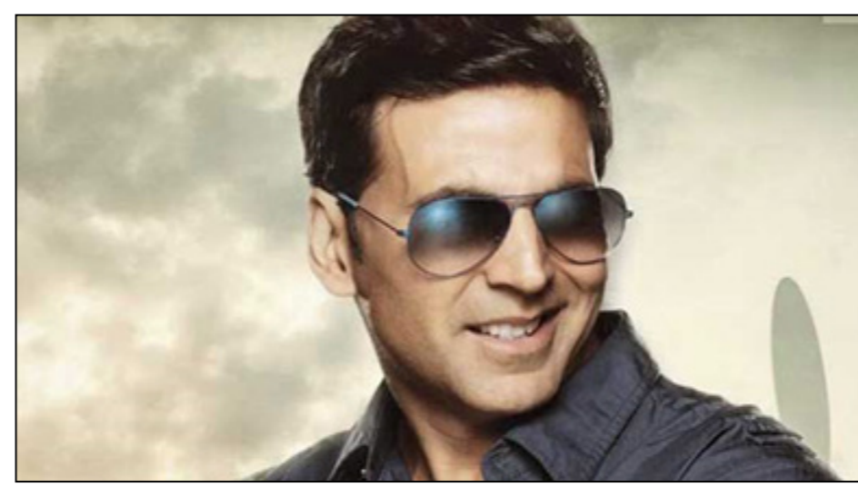
تولید می شود. تا به حال هیچ فیلم هندی با چنین رقم کلان، وارد مرحله تولید نشده است.

با آن که کلید فیلم برداری «وولورین ۳» زده شده، هنوز کسی اطلاعی از خط کلی داستان قسمت تازه این مجموعه فیلم اکشن کمیک استریپی ندارد. تهیه کنندگان فیلم در کمیته فوکس قرن بیستم قول داده بودند همزمان با شروع کار فیلم برداری، داستان آن را در اختیار رسانه های گروهی بگذارند. منابع نزدیک به کمیته می گویند مسئولان آن امیدوارند با سکوت در باره داستان فیلم، به رمز و راز ایجاد شده پیرامون این اکشن ابرقهرمانانه دامن بزنند. این در حالی است که همزمان با آغاز تولید فیلم، هیو جکمن بازیگر نقش کاراکتر مرد گرگ نما اعلام کرد این آخرین باری است که وی در این نقش ظاهر می شود. داستان این مجموعه فیلم، او نقش ابرقهرمانی به نام لاگن را دارد که در هنگام خطر تبدیل به ابرقهرمانی با حال و هوای یک گرگ می شود. تنها نکته ای که در ارتباط با داستان فیلم لو رفته، این است که در یک آینده نزدیک اتفاق می افتد و تعدادی از کاراکترهای مهم مجموعه فیلم «مردان ایکس» هم در آن حضور دارند. به نوشته امپایر آنلاین، جیمز منگولد امیر کارگردانی «وولورین ۳» را به عهده دارد. فیلم نامه فیلم را دیوید جیمز کلی نوشته است. این فیلم برای سوم ماه مارچ ۲۰۱۷ به روی پرده سینماهای جهان می رود. مجموعه فیلم «وولورین» از دل مجموعه فیلم «مردان ایکس» بیرون درآمد. کاراکتر مرد گرگ نما که شخصیت اصلی این مجموعه فیلم بود، در کنار حضور در آن در مجموعه فیلم «وولورین» هم حاضر شد.