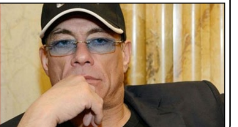
این حملات را پذیرفته است.

ژان کلود ون دم بازیگر نقش‌های اکشن پیامی علیه حملات تروریستی در بلجیم منتشر کرد. ژان کلود ون دم با صدور پیامی علیه حملاتی صحبت کرد که شهر زادگاهش بروکسل را در ماتم فرو برد. این بازیگر ۵۵ ساله با بیان رنج عمیقش از بمب‌گذاری در بروکسل که تاکنون جان ۲۴ نفر را گرفته، گفت: برای جهان دعا کنیم. وی در پست اینستاگرامش نوشت: دل من در این روزهای خیلی خیلی غمگین با قربانیان این رویدادهاست، با خانواده‌های آنها و همه مردم کشور زادگاهم بلجیم. وی افزود: نمی‌توانم بگویم قلم‌چقدر دردمند است. او در یک پست دیگر افزود: احترام عمیق و عشق برای آنهاست که برای ما مبارزه می‌کنند و نیز برای خانواده‌های آنها که پشت سر آنها هستند و از آنها حمایت می‌کنند. من این روزها هم‌هاش با بلجیم هستم. احترام عمیقم را برای آنهاست که چنین مبارزه می‌کنند تقدیم می‌کنم. ون دم در کنار این پست تصویری از گروه ضد تروریست بلجیم را منتشر کرده است. ون دم متولد محله سل آگاتا برشه در بروکسل است. در سه بمب‌گذاری بروکسل تاکنون ۲۴ تن کشته و بیش از ۱۰۰ نفر مجروح شده‌اند. داعش مسئولیت این حملات را پذیرفته است.