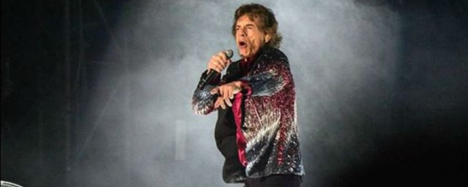
بودند که هیچ‌گاه از عشق خود به استونز و دیگر گروه‌های موسیقی چیزی به زبان نمی‌آوردند. میک جگر، خواننده رولینگ استونز، ابتدا به زبان اسپانیایی به علاقمندانش خوشامد گفت. اجرای این کنسرت چند روز پس از دیدار تاریخی باراک

اوباما، رئیس جمهوری آمریکا از کیوبا صورت گرفت. در این کنسرت دو ساعته، رولینگ استونز ۱۸ آهنگ خود را اجرا کرد. برگزاری کنسرت رولینگ استونز نشانه دیگری از تغییر واقعی در کیوبا است. تا حدود ۱۵ سال پیش، دولت کمونیست کیوبا برگزاری بیشتر کنسرت‌های راک و پاپ غربی را ممنوع کرده بود. ویل گرانث، خبرنگار بی بی سی در هاوانا می‌گوید کیوبا در سال‌های اخیر به صورت عمده ای تغییر کرده است، بخصوص در ۱۸ ماه گذشته که برقراری روابط حسنه با آمریکا را سرعت بخشیده است. یکی از طرفداران رولینگ استونز به بی بی سی گفت: «ممنوع بود. نمی‌توانستیم بیتلز یا دیگر گروه‌ها را از آمریکای لاتین در اینجا داشته باشیم. حالا اجازه داریم هر چه می‌خواهیم گوش کنیم.» یکی دیگر از علاقمندان این گروه گفت: «سفر اوباما، و حالا هم رولینگ استونز. بی نظیر و تاریخی است. برای همین، خوبه که اینجایم.» (بی بی سی)