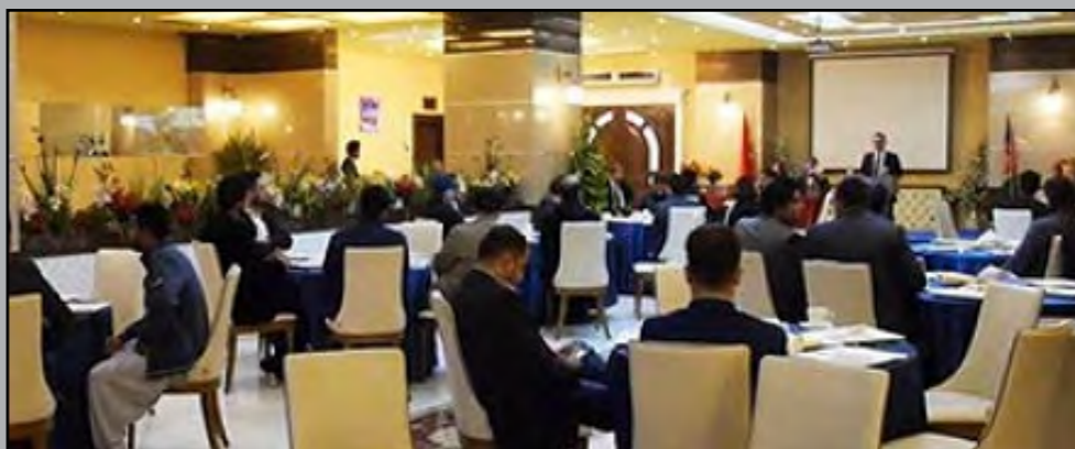
نخستین سینمای خانوادگی زیر نام (کهکشان) روز یکشنبه از سوی مقام های وزارت اطلاعات و فرهنگ در کابل گشایش یافت. مراسم که به مناسبت گشایش سینما کهکشان در مراسم...