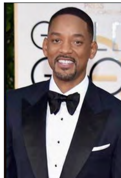
در پی بالاگرفتن اعتراض‌ها نسبت به غیبت هر گونه غیرسفیدپوست در میان نامزدهای جوایز اسکار، داستین هافمن و ویل اسمیت، بازیگران آمریکایی، نیز به منتقدان پیوستند.

مشکل را فراتر از نامزدشدن خود دانسته و گفته مشکل این است که فرزندان ما به تماشای اسکار خواهند نشست و خود را در آن نخواهند دید. او گفته است که «این بار نمی توانیم صرفاً پشیمانی و بگویم ایرادی ندارد.» پیشتر، جورج کلونی نیز آکادمی علوم و هنرهای سینمایی را متهم کرده بود که «در جهت غلط حرکت می کند.» با این حال، شریل بون ایزاکز، رئیس آکادمی، در بیانیه ای نوشته است که طی چهار سال گذشته در شرایط عضویت در آکادمی تغییراتی داده شده است تا تنوع کافی در میان اعضا تضمین شود، «ولی این تغییرات سرعت کافی نداشته است.»