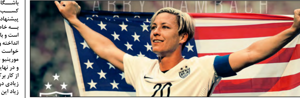
کریستین سینسر، بازیکن فوتبال آمریکا، جشن می برد.

داد. او در ۱۵ سال حضورش در تیم ملی این کشور ۲۵۵ بازی انجام داد و ۱۸۴ گل نیز به ثمر رساند. او علاوه بر این که بهترین گلزن فوتبال ملی زنان است با این میزان گل زده بهترین گلزن فوتبال در بخش مردان و زنان است. بهترین گلزن ملی مردان جهان، علی دایی با ۱۰۹ گل ملی است. او همسرا با تیم ملی آمریکا در جام های جهانی ۲۰۰۳، ۲۰۰۷، ۲۰۱۱ و ۲۰۱۵ شرکت کرد اما تنها در آخرین دوره حضورش با تیم ملی آمریکا اولین قهرمانی اش در جهان را جشن گرفت. او در جام جهانی ۲۵ بازی انجام داد و ۱۴ گل