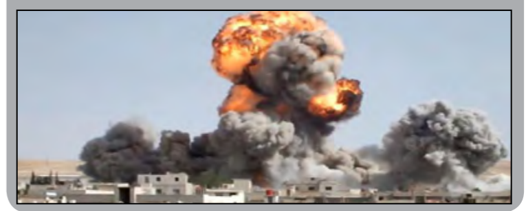
تصویری از انفجار در سوریه.

مارک تونر همچنان از یک صحبت تلفونی جان کبری وزیر خارجه ایالات متحده آمریکا با سرگئی لاوروف همتای روسی اش خبر داده است که در آن جان کبری