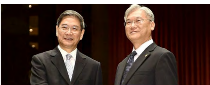
دو مقام رسمی از تایوان و چین در جریان افتتاح خط تلفن اضطراری.

بر اساس این گزارش، این دو نفر «از این فرصت برای تقدیر از پیشرفت هایی که طی یک سال گذشته در کاهش تنش و بهبود روابط دوجانبه به دست آمده استفاده کردند.» شورای امور سرزمین