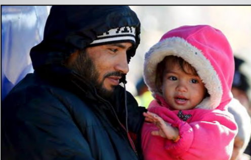
یک موسسه تحقیقات اقتصادی معتبر می‌گوید که موج آوارگان سالانه تا ۵۵ میلیارد یورو (۶۰ میلیارد دلار) خرج روی دست آلمان می‌گذارد. پژوهشگران این موسسه اما می‌گویند که این هزینه قابل مدیریت است. «انستیتوت اقتصاد جهان» که در شهر کیل آلمان موقعیت دارد، روز جمعه با نشر گزارشی گفت که با توجه به شمار آوارگانی که ممکن است سال‌های آینده به آلمان بیایند، هزینه پناهجویان بر دوش آلمان سالانه بین ۲۵ تا ۵۵ میلیارد یورو خواهد بود. به گفته این تحقیق، آلمان که در سال روان میزان حدود یک میلیون آواره است، هزینه‌ای حدود ۵۵ میلیارد یورو را متحمل می‌شود؛ اما با این فرض که شمار پناهجویان تا سال ۲۰۱۸ به ۳۶۰ هزار نفر کاهش یابد، هزینه سالانه پناهجویان به ۲۵ میلیارد دلار کاهش خواهد یافت. متیاس لوه، نویسنده