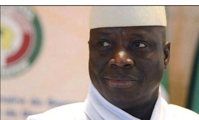
یحیی جامه، رئیس‌جمهور گامبیا، در این کشور که اکثریت آن مسلمان هستند، جمهوری اسلامی اعلام کرد. آقای جامه به تلویزیون دولتی این کشور گفته است که اعلام جمهوری اسلامی مطابق با «ارزش‌ها و هویت اسلامی» در این کشور است. رئیس‌جمهور گامبیا در توضیح علت اعلام جمهوری اسلامی در این کشور افزود: «ما توجه به این که اکثریت مردم این کشور مسلمان هستند، گامبیا نمی‌تواند به قوانین استعماری ادامه دهد». رئیس‌جمهور گامبیا تأکید کرده که پوشش خاصی به شهروندان تحمیل نخواهد شد و بیرون سابر ادیان اجازه خواهند داشت تا آزادانه از تعالیم خود پیروی کنند.

این گزارش گفت که ایمن آمار و ارقام می‌گوید که موج آوارگان سالانه تا ۵۵ میلیارد یورو (۶۰ میلیارد دلار) خرج روی دست آلمان می‌گذارد. پژوهشگران این موسسه اما می‌گویند که این هزینه قابل مدیریت است. «انستیتوت اقتصاد جهان» که در شهر کیل آلمان موقعیت دارد، روز جمعه با نشر گزارشی گفت که با توجه به شمار آوارگانی که ممکن است سال‌های آینده به آلمان بیایند، هزینه پناهجویان بر دوش آلمان سالانه بین ۲۵ تا ۵۵ میلیارد یورو خواهد بود. به گفته این تحقیق، آلمان که در سال روان میزان حدود یک میلیون آواره است، هزینه‌ای حدود ۵۵ میلیارد یورو را متحمل می‌شود؛ اما با این فرض که شمار پناهجویان تا سال ۲۰۱۸ به ۳۶۰ هزار نفر کاهش یابد، هزینه سالانه پناهجویان به ۲۵ میلیارد دلار کاهش خواهد یافت. متیاس لوه، نویسنده