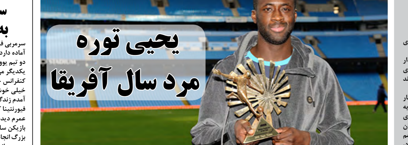
یحمیی توره به عنوان بهترین بازیکن ۲۰۱۵ قاره آفریقا حضور داشت. در نهایت یحمیی توره هافبک منچستر سیتی که در امر بازیسازی و تخریب حملات حریف یکی از بازیکنان نمونه در دنیای فوتبال محسوب می‌شود به عنوان بهترین بازیکن سال ۲۰۱۵ انتخاب شد تا برای ساحل عاج نیز افتخار دیگر کسب کرده باشد. به نقل از بی بی سی اسپورتن،

سرمربی فیورنتینا گفته تیمش برای مقابله با یوونتوس نیاز به قلب و ذهنی آماده دارد. دو تیم یوونتوس و فیورنتینا در شانزدهمین هفته از سری آ به مصاف یکدیگر می‌روند. سرمربی فیورنتینا، پاتولو سوسا در مورد این بازی در کنفرانس خبری قبل از بازی گفت: خیلی خوشحالم که در چنین جایگاهی هستیم. از روزی که به فلورانس آمدم زندگی من تغییر کرد و این فرصت را داشتم تا با تیم دوست داشتنی فیورنتینا کار کنم. این شانس را داشتم تا بهترین هوادارانی که در تمام عمرم دیده‌ام را در حمایت خود داشته باشم. بازیکن سابق یوونتوس ادامه داد: ما تیم قدرتمندی بازی داریم که کارهای بزرگ انجام داده است. توانسته خود را از بحرانی که ابتدای فصل گرفتارش بود، برهاند و حالا در قامت یک تیم مدعی ظاهر شده است. از قدرت این تیم آگاهیم، برای مقابله با چنین تیمی باید از اطمینان قلبی بالا برخوردار باشیم و ذهنمان را آماده کنیم. آنها هم از قدرت ما خبر دارند، ما در این فصل یکی از مدعیان اصلی کسب جام هستیم، در حالی که تا همین الان هم عالی کار کرده ایم.