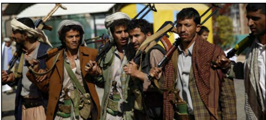
نماینده شبه‌نظامیان حوثی در مذاکرات صلح یمن اعلام کرده است که از روز دوشنبه ۱۴ دسامبر آتش‌بس میان طرف‌های درگیر در جنگ یمن آغاز خواهد شد. به گزارش رویترز محمد عبدالسلام، نماینده حوثی‌ها، روز شنبه در یک نشست خبری در صنعاء، پایتخت یمن گفت که این آتش‌بس «بر اساس توافق صورت‌گرفته» اجرا خواهد شد. مذاکرات صلح یمن این هفته در سوئیس برگزار می‌شود. سازمان ملل متحد از عبدربه منصور هادی، رئیس‌جمهور تبعیدی این کشور و شبه‌نظامیان حوثی دعوت کرده است که در این مذاکرات که از روز سه‌شنبه ۱۵ دسامبر آغاز می‌شود، شرکت کنند. این دعوت بعد از آن صورت گرفت که دو طرف بر سر کلیات

ترکیه، توئیتر را به دلیل عدم حذف آنچه تبلیغات تروریستی در این شبکه اجتماعی خوانده، جریمه کرده است. توئیترس باید ۱۵۰ هزار لیر ترکیه (۳۲ هزار پوند) به دولت ترکیه پرداخت کند. این برای اولین بار است که توئیتر باید چنین جریمه‌ای بپردازد. هنوز جزئیات زیادی در این باره منتشر نشده اما خبرنگار بی بی سی می‌گوید منظور دولت ترکیه، مطالبی است که در یک شناسه توئیتر در انتقاد از دولت ترکیه منتشر شده است. توئیتر در این باره هنوز اظهارنظری نکرده است. توئیتر تا کنون چندین بار با دولت ترکیه به مشکل برخورد کرده است. در ماه اپریل امسال، دادگاهی دولت ترکیه دستور مسدود شدن توئیتر و فیسبوک را داد. دلیل این ممنوعیت، جلوگیری از انتشار تصاویر گروگان گرفتن یک مقام قضایی بود. سال گذشته نیز دسترسی به توئیتر و یوتیوب در ترکیه برای مدتی محدود شد بود. علت آن انتشار فایل‌های صوتی بود که شماری از اعضای دولت را به دست داشتن در فساد مالی متهم می‌کرد. (بی بی سی)