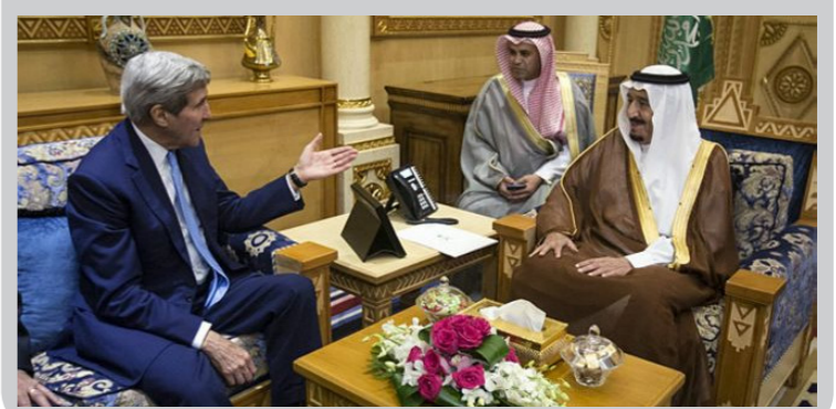
سوریه مذاکره کرد. (بی بی سی)

این بیانیه پس از دیدار جان کری، وزیر خارجه آمریکا با ملک سلمان، پادشاه عربستان منتشر شد. آقای کری روز شنبه با پادشاه، و ولیعهد عربستان در ریاض دیدار کرد. در بیانیه وزارت خارجه آمریکا به جزئیات حمایت‌هایی که قرار است از «مخالفان میانه‌رو» دولت بشار اسد بشود، اشاره‌ای