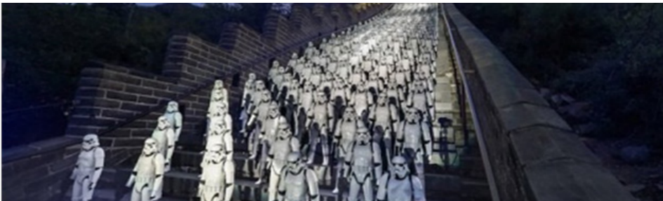
«جنگ ستارگان، نیرو برمی‌خیزد» از ۱۸ دسامبر

پس از انتشار تریلر نهایی فیلم حالا نوبت به تبلیغات گسترده فیلم در دومین بازار بزرگ سینمای جهان رسیده است. از آن جا که بهترین مکان برای تبلیغ هر چیزی در چین، دیوار بزرگ است. دیزنی نیز ۵۰۰ استورم ترور را از دیوار «جنگ ستارگان» به این مکان آورده است.