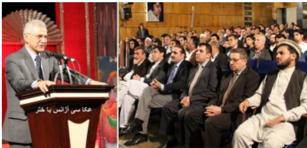
مختلف ورزش و هنری که بر علاوه آن که در زمینه های متذکره خوب درخشیده اند ، دست آورد های خوبی نیز در نتیجه رقابت های ملی و بین المللی به کشور کمیاب کرده اند. وی افزود که با وجود مشکلات که در شرایط