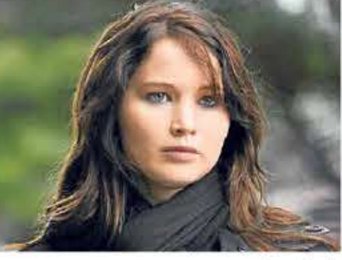
سال ها بوده است.

سنندرا بولاک در سال ۲۰۱۴ پردرآمدترین بازیگر زن بود. او امسال حتی در ده تای برتر جدول هم حضور نداشت. دستمزد او از ۵۱ میلیون دلار در سال ۲۰۱۴ به ۸ میلیون دلار رسیده است. دیگر بازیگران خوب همچون اما استون نیز شامل این حال می شود که امسال ۶.۵ میلیون دلار و یا کریستن استیوارت امسال ۱۰ میلیون دلار درآمد داشتند. این امر هم تنها به دلیل بازی های کوچک و مستقل آنها در این