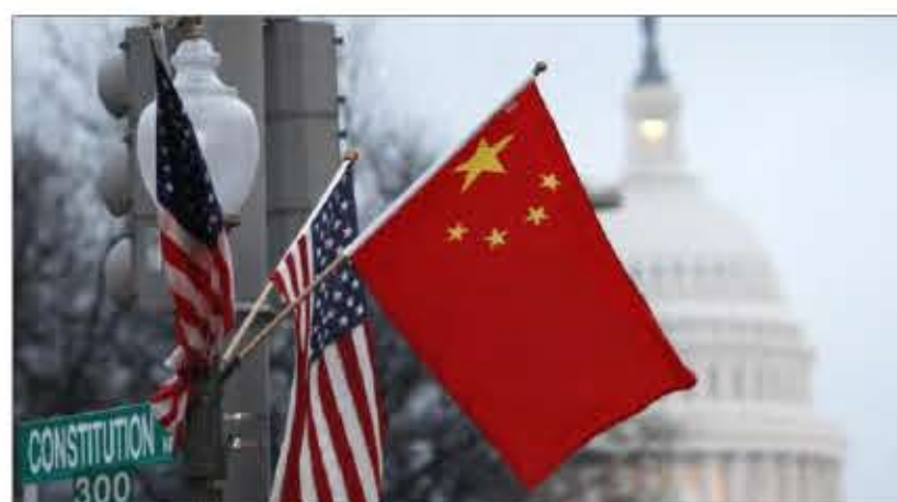
طالبان حضور داشت. همچنان چین در بخش سرمایه‌گذاری در افغانستان فعالیت داشته و سرمایه‌گذاری در بخش صلح و ثبات

کدام تلاش از سوی آن کشور صورت نگرفته است. جان کربی سخنگوی وزارت خارجه امریکاروز پنجشنبه به خبرنگاران در واشنگتن گفت: «هند در افغانستان نقش سازنده ای در چندین سال گذشته داشته است.» به گفته او، ایالات متحده انتظار دارد که چین هم نقش مشابه این کشور را در افغانستان ایفا کند. هند تا حالا با افغانستان حدود دو میلیارد دلار کمک کرده و در بخش‌های بازسازی این کشور نقش داشته است. سخنگوی وزارت خارجه امریکا می‌گوید، کشورش می‌خواهد که افغانستان در منطقه یک همسایه خوب باشد، زیرا همسایه‌های زیاد دارد و در عین حال چین و هند، همسایه و همکاران منطقه‌ای هستند..... ادامه/ص ۵