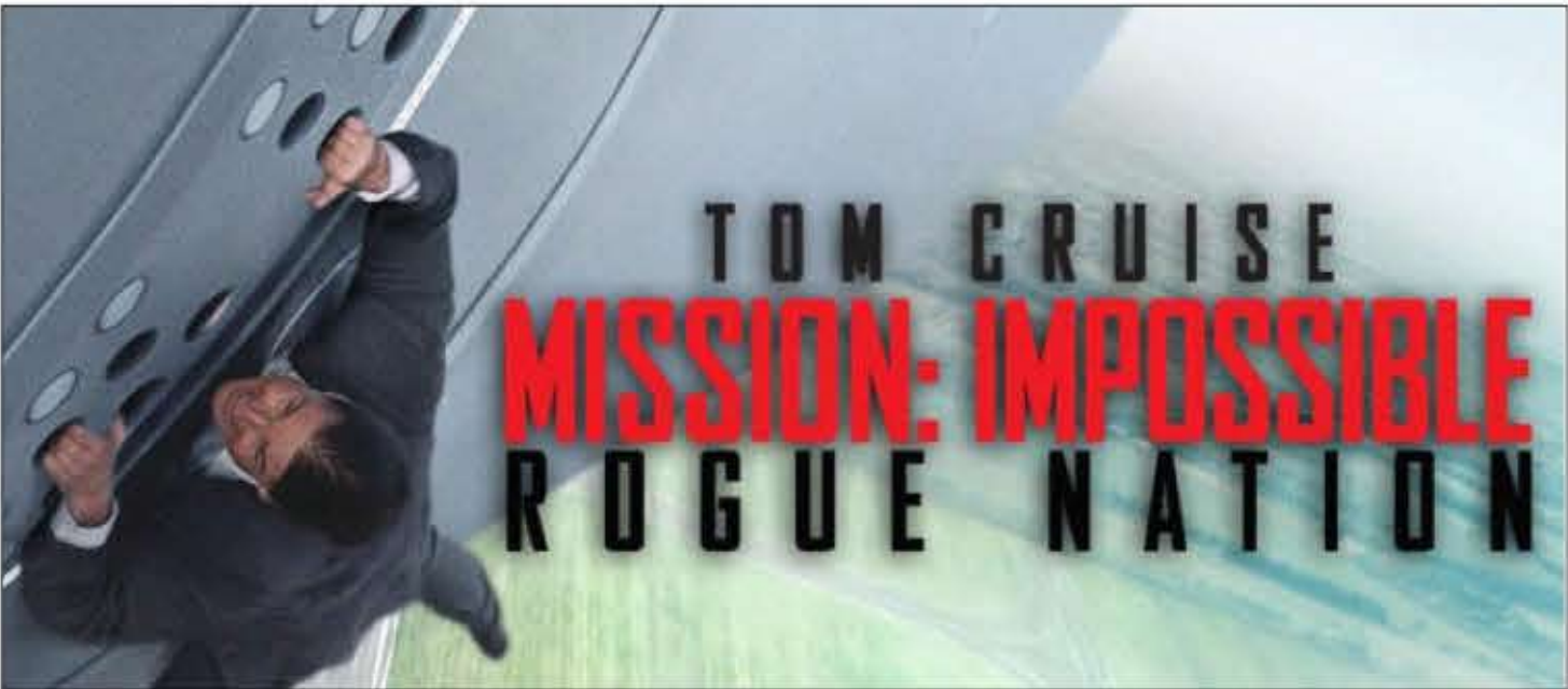
فیژیکی کروز دچار شگفتی می‌شود. او می‌گوید: واقعا کروز اگر بازیگر نمی‌شد، می‌توانست یک بدلکار درجه

اما تازه اعلام شده که او جز این کار، کارهای خطرناک و غیرممکن دیگری هم انجام داده است؛ از جمله در یک صحنه کلییدی از فیلم که کروز در نقش مامور اتان هانت ظاهر می‌شود، او باید مسیری را زیر آبی طی کند تا به چپ کامپیوتری برسد که ممکن است او را به شخصیت منفی فیلم، نزدیک کند. او در تمام این صحنه‌ها نفسش را واقعا زیر آب حبس کرده و در صحنه‌ای دیگر از یک جرنقیل بزرگ به ارتفاع ۱۲۰