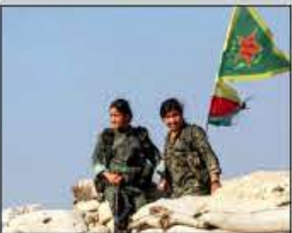
است. (بی بی سی)

یکان های مدافع خلق (ی پ ک)، نیروی نظامی کردهای سوریه، اعلام کرده که به رغم اعلام رسمی بی طرفی این نیرو در قبال درگیری های نیروهای ترکیه و حزب کارگران کردستان (پ ک ک) و تاکتیک های هواپیماهای ترکیه چندین بار مواضع ی پ ک را هدف گرفته اند. ی پ ک با انتشار بیانیه ای از کشورهای ی که به رهبری آمریکا ائتلافی علیه گروه موسوم به دولت اسلامی (داعش) شکل داده اند، خواسته است مواضع روشنی درباره این حملات ترکیه بگیرند. در بیانیه ی پ ک آمده است: «ما تحریکات اخیر ارتش ترکیه را خصمانه و تحریک ارزشیابی می کنیم و از دولت ترکیه می خواهیم که عملکرد خود را روشن و این اقدامات را متوقف کنند. در واقع تداوم این اقدامات تحریک آمیز می تواند پیامدهای منفی داشته باشد که دولت ترکیه مسئول آن خواهد بود.» ترکیه از هفته گذشته یک رشته حملات هوایی را علیه داعش در سوریه و پ ک ک در شمال عراق آغاز کرده است. ناتو با ترکیه اعلام همبستگی کرده و آمریکا هم گفته این کشور حق دفاع از خود را دارد. دیروز گزارش شد که در حمله اخیر ترکیه به مواضع پ ک ک در عراق، ۱۰ غیرنظامی