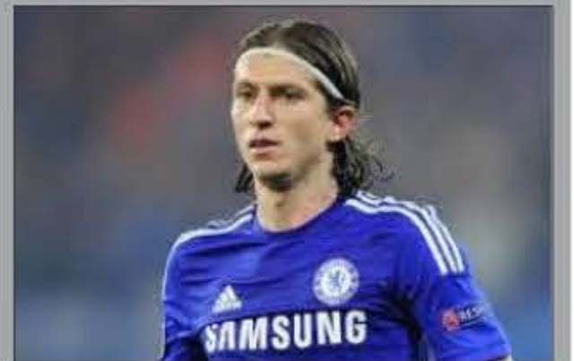
ها مذاکره، بر سر انتقال ۱۶ میلیونی لوتیسی به اتلتیکو توافق کردند و این بازیکن با عقد قراردادی ۴ ساله به تیم سابق خود بازگشت.

در حالیکه طبق توافق اولیه دو باشگاه، همه چیز برای انتقال ۱۵ میلیونی لوتیسی آماده بود، در آخرین لحظات باشگاه چلسی رقم درخواستی خود را افزایش داد اما طبق گزارش رسانه‌های اسپانیایی، دو طرف پس از ساعت