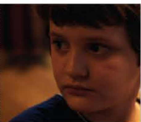
بازیگر اصلی فیلم «پدر»