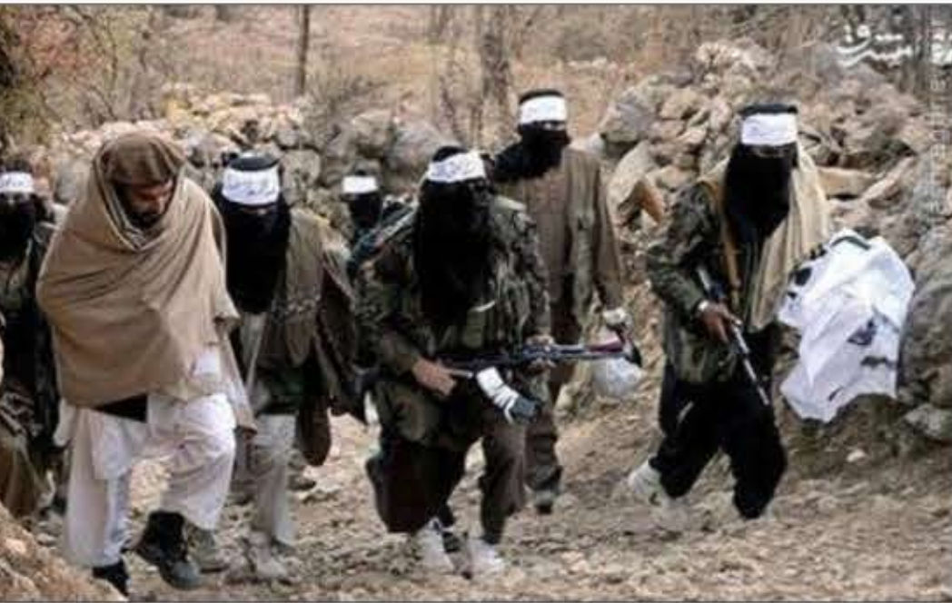
محل تدفین قربانیان داعش در شمال غربی کابل. در این منطقه نیز آسپس می بینند. به این خاطر، کشور های منطقه نیز نباید در این زمینه محاسبه اشتباه نمایند.

با توجه به ظرفیت بالای افغانستان در پرورش گروه های تندرو به نظر می رسد، که این گروه از کشورهای مختلف در افغانستان نیز جذب نموده است. مطالعات که در مورد کشورهای آسیای میانه صورت گرفته است نشان می دهد که بخش زیادی از مسلمانان این کشور ها از کارگرد و عملکرد دولت ناراضی است و