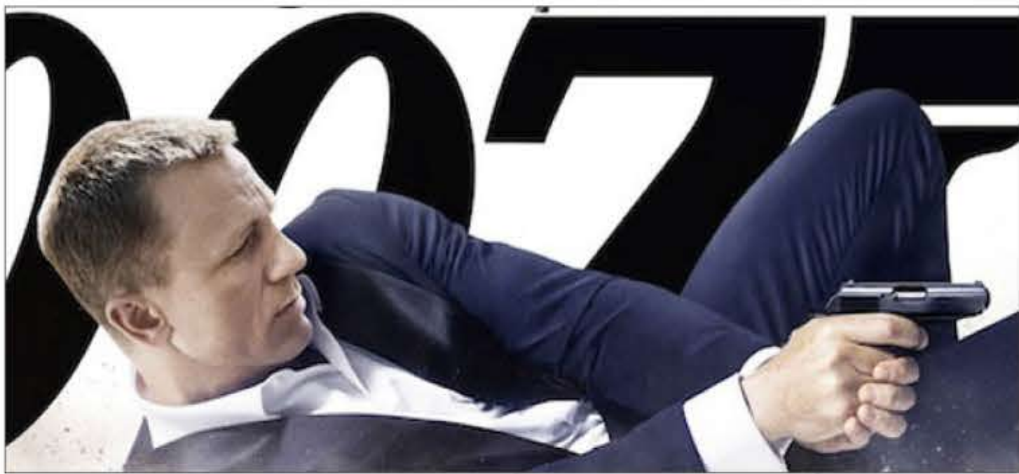
پیش بینی می شود استودیوهای آمریکایی و در راس آنها برادران وارنر و سونی پیکچرز جدال سختی بر سر جیمز باند در ماه های آتی داشته باشند. با اکران «اسپکتر» قرارداد کمپنی های مترو گلدوین