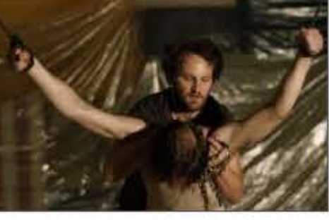
هیو جکمن در نقش هیو جکمن در فیلم «پن»

کارول هیلز تهیه کننده این مستند نیز اشاره می‌کند که به