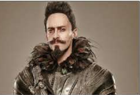
هیو جکمن در نقش هیو جکمن در فیلم «پن»

این فیلم بر اساس شخصیت پیتر پن است که توسط نویسنده اسکاتلندی، جی ام بری در سال ۱۹۰۲ میلادی خلق شد. یونایتد پرس نوشت، فیلم «پن» روایت‌گر قصه اصلی پیتر پن و جیمز هاک، کاپیتان هاک آینده است. این فیلم در هفدهم