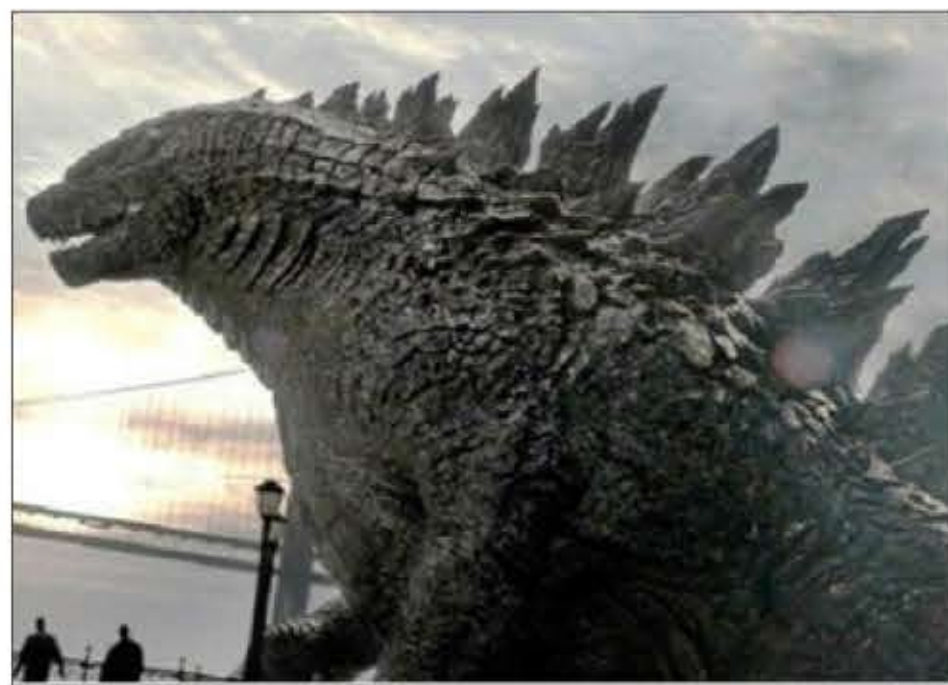
گودزیلا در فیلم «گودزیلا»

به خریداران بالقوه این فیلم منتشر شده، به این نکته اشاره کرد که فیلم «غول‌پیکر» درباره حمله به شهر توکیو توسط گودزیلا و یک روبات بزرگ است. این کمپانی جاپانی همچنین ادعا می‌کند که ویگالوندو نیم‌رخس از این هیولا را روی جلد فیلم به کار برده است. ادعای شش بخشی این کمپانی به مصاحبه‌ای از ویگالوندو نیز اشاره می‌کند که او در آن می‌گوید قصد ساخت «ارزان‌ترین فیلم گودزیلا تاریخ» را دارد و علاوه بر این قصد دارد پوستری از فیلم وولتاز را در کن نشان دهد که قیافه‌اش شبیه گودزیلاست. کلابی که به نیابت از کمپانی توهو این دعوی قانونی را ثبت کرده‌اند، می‌گویند: هیچ ظرافتی در مورد رفتار خواننده این پرونده وجود ندارد. آن‌ها به وضوح دارند به جامعه سرگرمی اطلاع می‌دهند که در حال ساخت یک فیلم گودزیلا هستند و دارند از آرم و تصاویر گودزیلا توهو برای جلب علاقه و سرمایه بیشتر برای پروژه خود استفاده می‌کنند. در حالی که حق کپی رایت این استفاده را از توهو نخریده‌اند. اینکه کسی با استفاده از این حد رسوایی بخواد از آثار حرفه‌ای دیگران استفاده کند به اندازه کافی غلط است. حالاً اینکه خواهان، که خود به خاطر حمایت شدید و همیشگی از حقوق کپی رایت‌اش شناخته می‌شود دارد این کار را انجام می‌دهد، اصلاً غیرقابل قبول است.