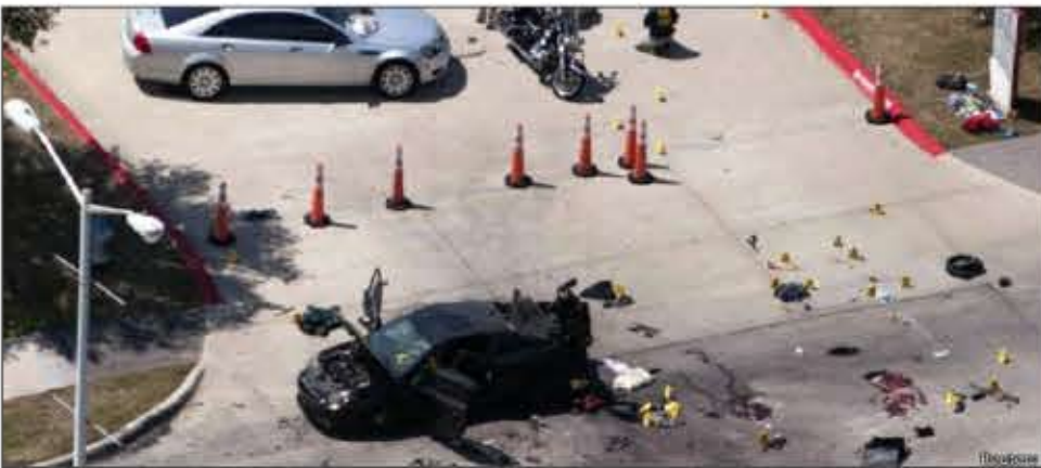
آفریقای جنوبی به سومالیا برود. نمایشگاه کاریکاتور از پیامبر اسلام بخشی از کنفرانسی بود که مرکز آمریکایی دفاع از آزادی برگزار کرده بود. پامسلا گلر، یک ویلاکتونیس فعال و جنجالی این مرکز را