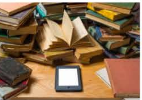
فروش کتاب های الکترونیکی در امریکا

بر این اساس بخش کودک و نوجوان به تنهایی ۱.۶ درصد کاهش را نشان می دهد. البته ۲۴.۱ درصد رشد فروش در بخش کتاب های مقوایی کودک را نیز در همین مدت نباید از یاد برد. از سوی دیگر آمار فروش کتاب در جنوری ۲۰۱۵ در امریکا رقمی معادل ۵۴۳ میلیون دلار را نشان می دهد که در مقایسه با مدت مشابه سال قبل ۰.۹ درصد رشد داشته است. آمار انجمن ناشران امریکا نشان می دهد در بخش نشر حرفه ای (شامل بیزنس، دکتری، حقوق، علوم و فناوری) فروش در ماه جنوری ۲۰۱۵ در مقایسه با مدت مشابه سال قبل بیش از ۱۰ درصد رشد داشته است و از سوی دیگر نشر دانشگاهی نیز ۱۲.۲ درصد کاهش را در این مدت تجربه کرده است.