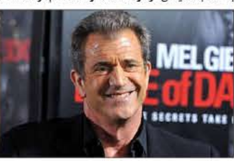
ساخت فیلم جدیدش بود، او پیش از مرگ با فیلم هایش دو بار در جشنواره کارلوویواری حضور یافت که در این میان یکبار نیز برنده جایزه شد.

جشنواره پنجاه ساله کارلوویواری برنامه های امسال خود را در حالی اعلام کرد که در آنها ساخت فیلمی به کارگردانی مل گیبسون ویژه این جشنواره دیده می شود. به گزارش سایت این جشنواره برنامه های پنجاهمین جشنواره بین المللی فیلم کارلوویواری با اعلام اکران فیلمی کوتاه از «مل گیبسون» منتشر شد. «گیبسون» این فیلم را مخصوص جشنواره کارلوویواری می سازد. وی که ساخت این فیلم را از اوایل ماه می در لس آنجلس آغاز می کند، سال گذشته از سوی این جشنواره برنده جایزه گوی کریستالی یک همکاری برجسته هنری با سینمای جهان شد. در جشنواره امسال همچنین قرار است هفته سینمای لبنان برگزار شود. در این هفته، به سینمای این کشور طی چند دهه اخیر پرداخته خواهد شد. از جمله فیلم هایی که قرار است در این هفته به نمایش در آید می توان به فیلم برجاشیه «بیروت غربی» ساخته «ریسا دوپری» محصول سال ۱۹۹۸ میلادی اشاره کرد. این فیلم در زمان خود با انتقادها و حواشی زیادی روبرو شد. تقدیر از «جان کازل» و «کریس پن» و بازیگر متوفی آمریکایی از دیگر برنامه های امسال خواهد بود. این دو امسال به ترتیب ۸۰ ساله و ۵۰ ساله می شوند. همچنین پنج فیلم از «لاریسا شپیتکو» کارگردان اکرابنی که سال ۱۹۷۹ در یک حادثه رانندگی در سن ۴۱ سالگی جان باخت به نمایش در خواهد آمد. او که هنگام مرگ مشغول