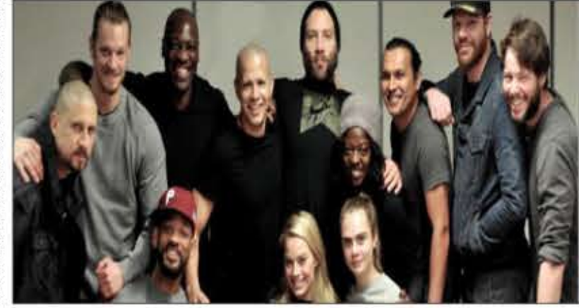
«جوخه خودکشی» بر اساس کتاب های مسور دی سسی دربار تبهکاران فرازمینی است که دولتشان به آنها فرصت رهایی می دهد اما همتر اینکه ماموریتی که به آنها داده

می شود همه آنها را خواهد کشت. «ویل اسمیت» نقش «ددشات» و «مارگوت رابی» نقش «هارلی کین» را ایفا خواهند کرد. «ویولا دیویس» ستاره فیلم «چگونه از مجازات قتل فرار کنیم؟» در نقش «اماندا والر» بازی خواهد کرد. از دیگر بازیگران فیلم «جوخه خودکشی» می توان به «کارادولین»، «جیم پاراک»، «آدام پیچ»، «ایکه بارنهلتز»، «جی رودریگز» و «اسکات ایستود» اشاره کرد. «جوخه خودکشی» پنجم آگوست ۲۰۱۶ روی پرده می رود.