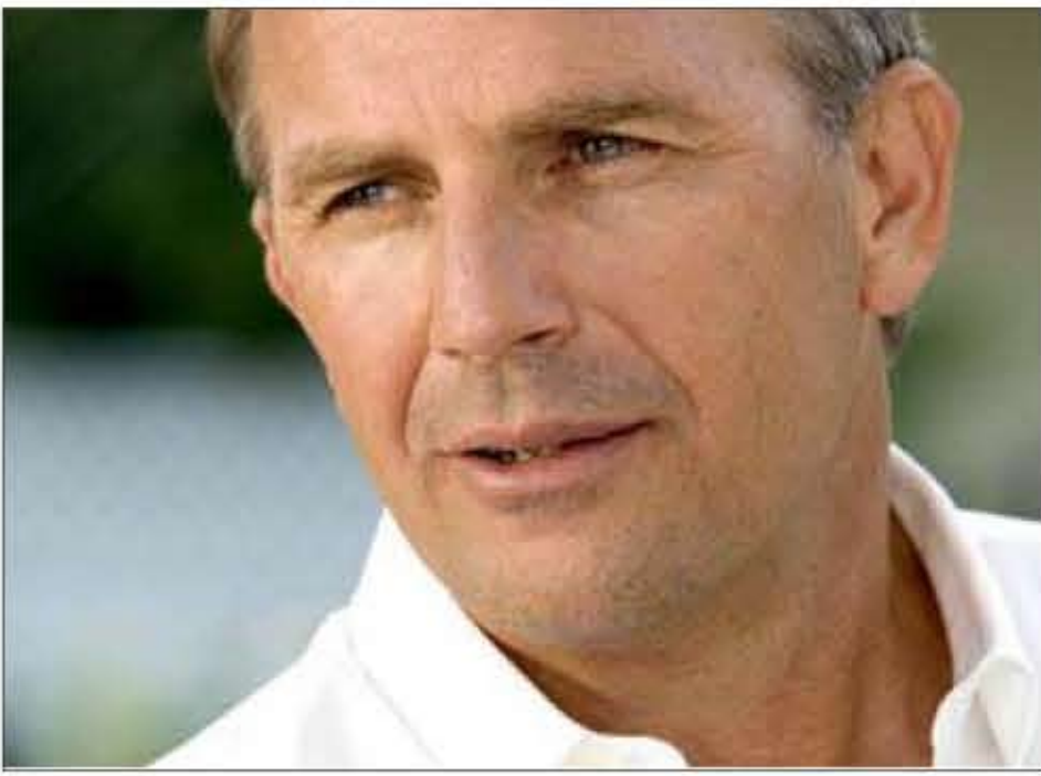
او فرزند ویلیام کاستنر (برق کار آلمانی-آمریکایی) کالیفرنیا به دنیا آمد و در کامپوتن، کالیفرنیا بزرگ شد. و شارون تدریک (ایرلندی تبار) است که در لاینوود،

برتون کاستنر را به ادامه حرفه بازیگری تشویق کرد و به او گفت که باید حتما در این رشته به کار خود ادامه دهد. کاستنر هم بلافاصله از شغل خود استعفا داد و به هالیوود رفت اما در هالیوود ابتدا موفق نبود و در چندین فیلمی هم که با زحمت در آنها نقشی بدست آورده بود، در تدوین نهایی مشاهده کرد که نقش او حذف شده! این مشکل تا سالها ادامه داشت تا اینکه وی در سال ۱۹۸۵ در فیلم «سپیلورادو» حضور یافت که اثری وسترن و ضعیف بود که در گیشه با شکست سنگینی مواجه شد. اما دو سال بعد کاستنر با بازی در فیلم «تسخیر ناپذیران» به کارگردانی بریان دی پالما توانست به سرعت به شهرت برسد و منتقدان نیز از بازی او در این فیلم تعجبید بعمل آوردند. کاستنر که حالا بازیگر مشهور تری شده بود، توانست در سالهای بعد نقش های بهتری بدست آورد اما نقطه عطف دوران حرفه ای او در سال ۱۹۹۰ رقم خورد یعنی سناری که او فیلم «با گرگها می رقصند» را کارگردانی کرد و خودش نیز در نقش اصلی آن حضور پیدا کرد. این فیلم توانست در مراسم اسکار سال ۱۹۹۰ موفقیتی عظیم بدست بیاورد و خود کاستنر هم توانست جایزه اسکار بهترین کارگردانی را بدست بیاورد و در بخش بازیگری نیز نامزد دریافت اسکار شود. کاستنر در سالهای بعد در آثار موفقیتی از جمله «JFK» و «بادی گارد» به ایفای نقش پرداخت و توانست جایگاه خود را در هالیوود تثبیت کند.