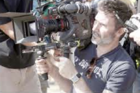
ایفای نقش کند. این فیلم طبق برنامه‌ریزی‌های انجام شده سال ۲۰۱۶ اکران می‌شود.

البته هازانائویشیوس از زمانی که «آرتیست» را کارگردانی کرده، یک فیلم دیگر نیز ساخته است. این فیلم که «جست و جو» نام دارد، درامی با بازی برنیس بژو و آنت بینینگ است که سال گذشته در جشنواره سینمایی کن مورد توجه قرار گرفت. احتمال دارد بژو در فیلم جدید هازانائویشیوس نیز