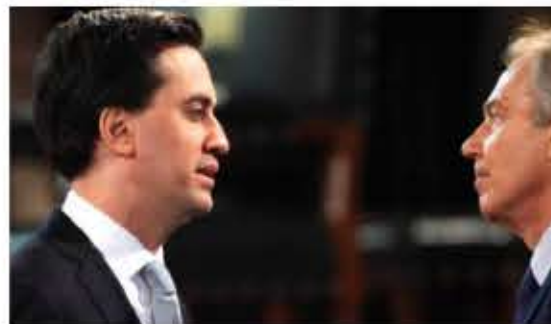
تونی بلر (را) و دیوید کامرون (چپ) در جریان سخنرانی در لندن. کامرون اخیراً پیروزی در انتخابات پارلمانی را جشن گرفته است.

تونی بلر گفته است که پیروزی دیوید کامرون، نخست وزیر بریتانیا در انتخابات پارلمانی کنونی و دنبال کردن سیاست او نسبت به عضویت بریتانیا در اتحادیه اروپا این کشور را با خطر هرج و مرج اقتصادی و ضعف سیاسی مواجه می‌کند. آقای بلر که در حمایت از حزب کارگر در مبارزات انتخاباتی جاری سخن می‌گفت، با انتقاد از وعده حزب حاکم محافظه‌کار برای به همه‌پرسی گذاشتن موضوع ادامه عضویت بریتانیا در اتحادیه اروپا، گفت که عمیقاً اعتقاد دارد که خروج از اتحادیه اروپا باعث تضعیف موقعیت بریتانیا در جهان خواهد شد. تونی بلر گفت که در