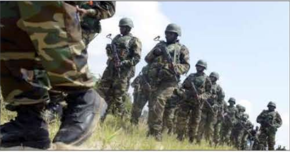
تروپست ها در جهان است. (بی بی سی)

بحال ماموریت این نیرو به ایمن کردن بخش نایجریا دریاچه چاد محدود می شود. با شروع تازه ترین عملیات در روز یکشنبه، یک شاهد عینی که در ناحیه مشغول امداد رسانی بوده به خبرگزاری فرانسه گفت که تبادل سنگین آتش در نزدیکی موز نایجر با ناجر یا در جریان بوده است. از ایستگاه رادپویی محلی گفت که کاروانی از بیش از ۲۰۰ وسیله نقلیه به سوی ناحیه در حرکت بوده است و روز شنبه و اوایل یکشنبه حملات هوایی هم انجام شد. ارتش ناجر یا اخیرا مدعی موفقیت های نظامی در ایالات مجاور بورتو شده و مقام های نایجریا می گویند که بیعت بوکو حرام با داعش نشانه ضعف این گروه است. گروه داعش از تابستان سال ۲۰۱۴ با تصرف بخش هایی از شرق سوریه و شمال غربی عراق، در این مناطق «خلافت اسلامی» تشکیل داده است. قومندان سامی عثمان کواشسکا سخنگوی ارتش نایجریا گفت که ابوبکر شکانو رهبر بوکو حرام مثل صردی «در حال غرق شدن است.» او به بی بی سی