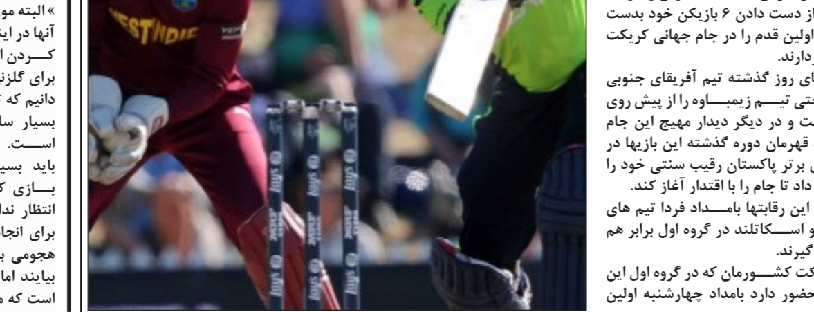
ادامه جام جهانی کریکت

زلاتان در این زمینه گفت: وقتی پس از گلزنی پیراهنم را در آوردم، همه از خود پرسیدند خالکوبی جدید او کجا هستند. من نام پنجاه نفر را به شکل موقتی روی بدنم خالکوبی کردم. اینها، نام کسانی است که در سراسر دنیا از مشکل تغذیه رنج می‌برند. ممکن است خالکوبی‌های من موقتی بوده و از بین برود اما کسانی