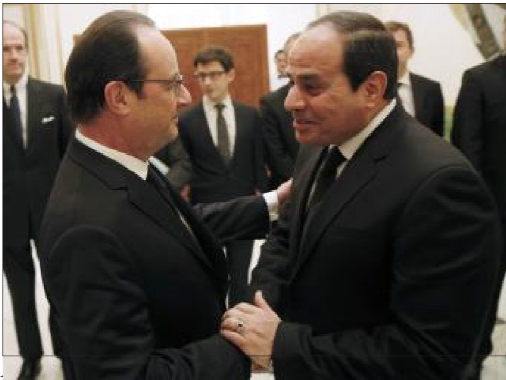
نخست‌وزیر فرانسه در جای دیگری از سخنانش گفت که باید هم در عرصه نظامی صورت بپذیرد و هم از طریق خشکاندن منابع مالی این گروه.