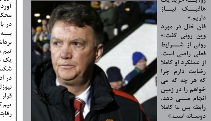
فان خال در مورد وین رونی گفت: «رونی از شرایط فعلی راضی است. از عملکرد او کاملاً رضایت دارم چرا که هر چه که می‌خواهم را در زمین انجام می‌دهد. رابطه بین ما کاملاً دوستانه است.»

فان خال در پاسخ به سئوالی در مورد نیاز یونایتد به یک هافبک جدید گفت: «الته، البته، من به دنبال ایجاد توازن بیشتر در تیم هستم. وقتی یانوزای و دی ماریا را در ترکیب قرار می‌دهم و در جلوی زمین نیز فالکانو و فان پرسی حضور دارند، در واقع با ۴ بازیکن خلاق مقابل حریف قرار گرفته‌ایم. به همین دلیل باید بازیکنانی پشت اینها حضور داشته باشد که بتوانند به خوبی توازن تیمی را حفظ کنند. به همین دلیل در تابستان پیش رو، بسه خرید یک هافبک نیاز داریم.»