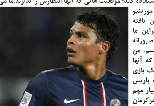
را حفظ کنیم.»

«الته مورینیو می‌داند که باید چه انتظاراتی از زلاتان داشته باشد زیرا آنها در اینتر با هم کار کردند. مطمئنم که چلسی برنامه‌هایی برای متوقف کردن او دارد اما مورینیو هم می‌داند که زلاتان می‌تواند از فرصتی برای گلزنی استفاده کند؛ موقعیتی‌هایی که آنها انتظارش را ندارند. ما می‌دانیم که تیم مورینیو بسیار سازمان‌یافته است. بنابراین ما باید بسیار صبورانه بازی کنیم. من انتظار ندارم که آنها برای انجام یک بازی هجومی به پاریس بیایند اما بسیار مهم است که ما تمرکزمان را حفظ کنیم.»