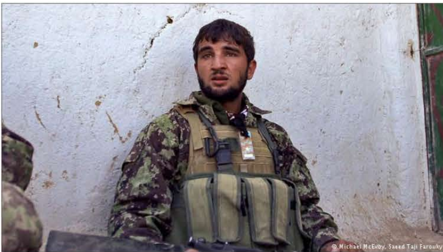
© Michael McEvoy, Saeed Taji Farouky

یک فیلم مستند راجع به زندگی سربازان افغان بعد از خروج نیروهای رزمی ناتو، در جشنواره بین المللی فیلم برلیناله، جایزه عفو بین الملل «هیئت داوران مستقل» را دریافت کرد. هیئت داوران از «تصویر قوی» این فیلم ستایش کردند.