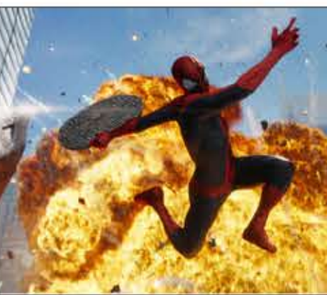
سونی خواهد بود.

سونی خواهد بود. در همین راستا کمپانی دیزنی که استودیوهای Marvel را در اختیار دارد تاریخ اکران برخی از فیلم های خود را برای جلوگیری از تداخل تغییر داده است.