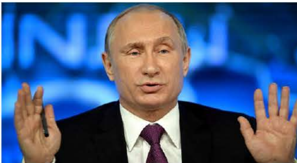
پوتین بار دیگر آمریکا و متحدانش را عامل جنگ در اوکراین دانست. او با دو یونگ کانگ، رئیس

در حالی که تلاش های دیپلماتیک برای خاتمه دادن به درگیری ها در شرق اوکراین ادامه دارد ولادیمیر پوتین، رئیس جمهور روسیه، آمریکا و متحدان این کشور را عامل بروز این درگیری ها دانسته است.