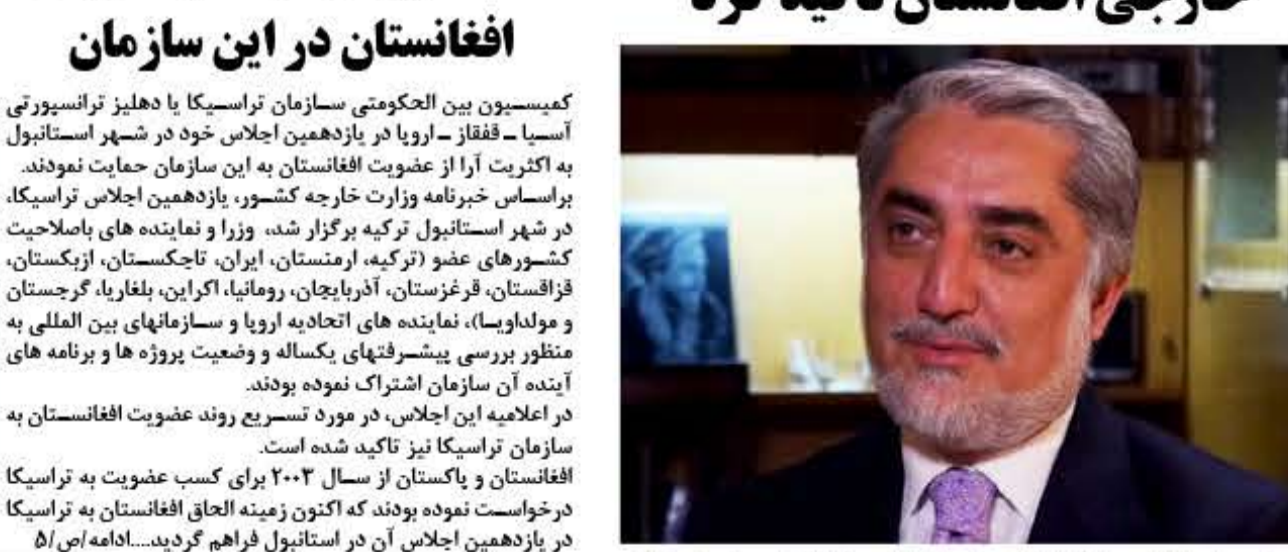
هر چند سياست خارجى افغانستان در چند سال اخير پيشرفت هاى چشمگیر داشته است اما رئيس اجرائى حکومت می گوید كه هنوز هم در اين خصوص مشكلات وجود دارد كه بايد برطرف گردد.