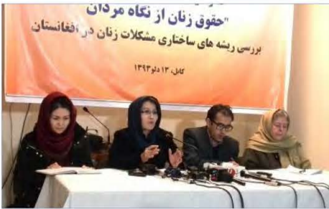
در تحقیقی که از سوی سازمان حقوق بشر و دیموکراسی افغانستان منتشر شده، آمده است که اکثر موارد خشونت ها و نقض حقوق زنان از سوی مردان، ریشه در ساختارهای اجتماعی و فرهنگی کشور دارد.

د کندهار ملي امنیت دوه تنه د تخريبي کړنو په تور ونيول... د کندهار ملي امنیت ریاست دوه تنه ترهکر چې په کندهار کې یې هدفي وژني او تخريبي فعالیتونه سرته رسول، ونيول.