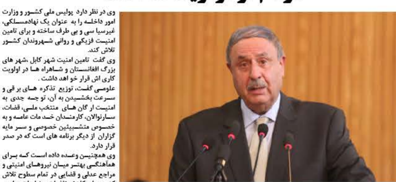
نورالحق علومى وزير امور داخله در مراسم معرفى اثن طى سخنانى گفت باتوجه شناخت و تجارب كه وى از اوضاع دارد، تطبيق قانون، مبارزه با فساد ادارى، سياسى كردن نيروى پوليس، تامين امنيت و ... را از اولويت هاى كارى خویش عنوان كرد.