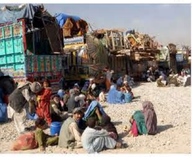
مناسب در مرز دو کشور ایجاد شود تا زمینه را برای بازگشت مهاجرین در دسامبر ۲۰۱۵ به کشورشان تسهیل کند.

دولت پاکستان به حکومت های ایالتی این کشور هدایت داده است تا مکان هایی را در مرز افغانستان برای تاسیس کمپ های جدید مهاجرین افغان، جهت تسهیل در عودت آن ها به کشورشان اختصاص دهد.