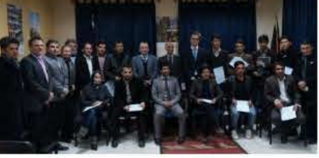
وزارت امور خارجه کشور آلمان با اعطای ۱۵ بورس تحصیلی در رشته جيولوجی معادن افغانستان را در زمینه استخراج معادن كمك كرد.