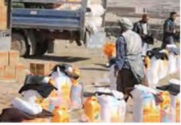
مستولان كميته اضطرار مقام ولايت هرات می گویند این كمك ها بر اساس سروي این كميته برای ۲۳۰ خانواده ای كه بیشترین مشكلات را داشتند توزيع شده است.

دسروز درهرات برای ۲۳۰ خانواده نيازمند كمك هاى مواد غذايى، لباس و خيمه توزيع شد. اين كمك ها به افراد بى جا شده داخلى از سوى كميته اضطرار ولايت هرات داده شده است.