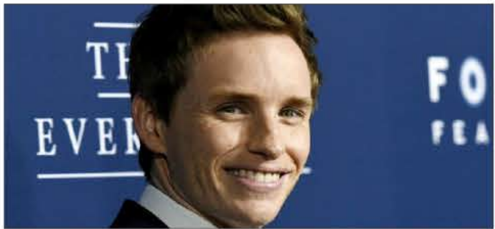
برنده جایزه شدند. داون تاون ای در بخش مجموعه تلویزیونی دراما و نازنجی همان سیاه است هم برای مراسم جوایز اسکار یکشنبه ۲۲ فبروری در هالیوود برگزار می‌شود. (بی بی سی)

ادی ردمین، بازیگر انگلیسی نقش استیون هاکنینگ در فیلم «نئوری همه چیز» با گرفتن جایزه انجمن بازیگران سینمای آمریکا شانس خود را برای گرفتن اسکار بهترین بازیگری افزایش داد. بهترین رقیب او مایکل کیتون، بازیگر فیلم بردمن مجموعاً جایزه بهترین گروه بازیگران را از این انجمن گرفتند. در بیست و یکمین دوره این مراسم که یکشنبه شب در لس آنجلس برگزار شد، جولین مور برای بازی در فیلم هنوز آلیس جایزه بهترین بازیگر نقش اصلی زن را گرفت. در بخش بهترین بازیگر نقش مکمل، پاتریسیا آرکت برای فیلم پسرچگی و جی کی سیمونز برای فیلم ویلش