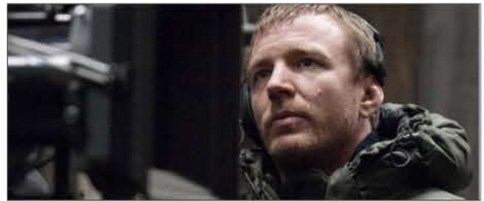
این فیلم را تبدیل به یک مجموعه فیلم دنباله دار بزودی علیه روسای خود قد علم می‌کنند.

سینمایی کند. در عین حال، وی اصرار دارد روایتی فانتزی از این داستان قدیمی ارائه دهد. این نسخه سینمایی در حالی وارد مرحله تولید می شود که قبل از این قرار بود دپوید دابکین هم، فیلمی با این مضمون جلوی دوربین برود. قرار بود نقش شاه آرتور این فیلم را کالین فارل بازی کند. گای ریچی در سال ۲۰۰۹ نسخه تازه‌ای از «شرلوک هلمز» را کارگردانی کرد که با استقبال بالایی تماشاگران و منتقدان روبرو شد. او در سال ۲۰۱۱ قسمت دوم این فیلم را ساخت. این فیلم ساز برای تابستان سال جاری میلادی نسخه دوباره‌سازی شده فیلم کلاسیک «مردی از آنکل» را به روی پرده سینماها می‌فرستد. قصه فیلم در دهه شصت میلادی اتفاق می‌افتد و در باره دو مامور سازمان‌های جاسوسی سیا و کا گ ب است که راهی یک مأموریت مشترک می شوند و