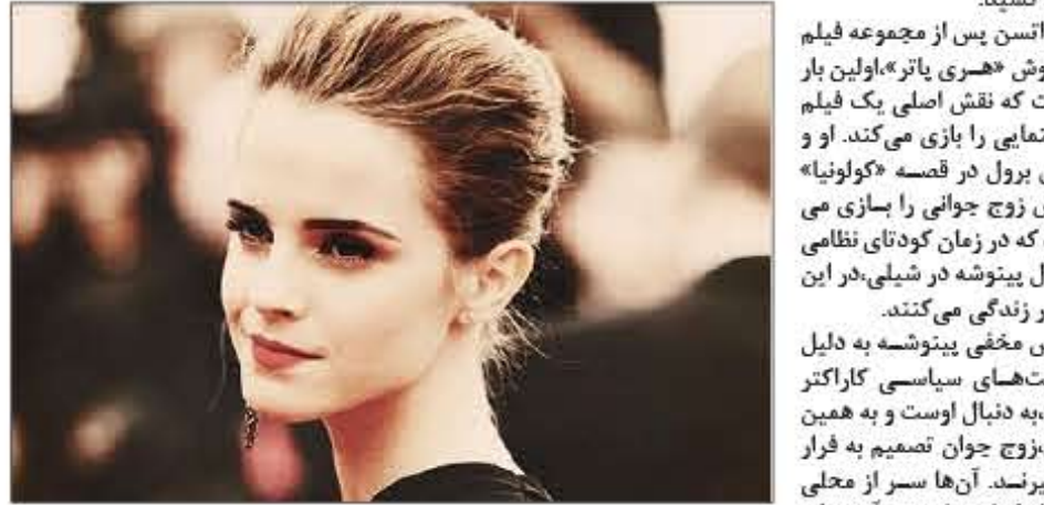
این فیلم برای نمایش عمومی در اواسط ماه اکتبر سال جاری میلادی، آماده می شود.

اما واتسن و دانیل برول بازیگران انگلیسی و آلمانی تبار سینما نقش های اصلی فیلم را بازی کرده اند. فلورین گالتربرگر کارگردان «کولونیا» است و صحنه های آن در آمریکای جنوبی، لوکرامبورگ، مونیخ و برلین فیلم برداری شده است. کار فیلم برداری این درام سیاسی ۴۵ روز طول کشید.