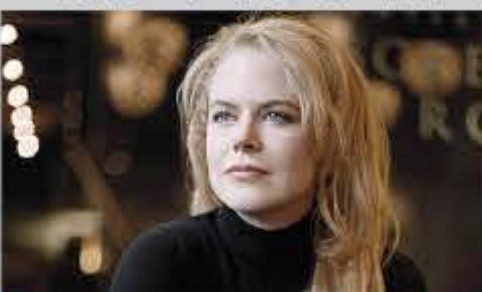
بعد دنبال رشته خود سعی می کند به استرالیا بازگردد.

نیکول کیدمن در یک فیلم استرالیایی با دیو پاتل بازیگر هندی فیلم میلیونر زاغه نشین همبازی شد. به گزارش از سینما بلند عنوان فیلم شیر است که اقتباسی از یک رمان استرالیایی با عنوان راه طولانی به خانه بوده و قرار است در سال ۲۰۱۶ به نمایش درآید.