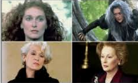
جوایز اسکار است، رکوردی که به نظر تا سالیان طولانی دست نیافتنی خواهد بود.

«هریل استریپ» بازیگر سرشناس سینمای جهان که بسیاری او را مستعدترین بازیگر زنده سینما می دانند، امسال برای نوزدهمین بار و برای فیلم «در جنگل» نام خود را در میان نامزدهای جایزه اسکار می بیند.