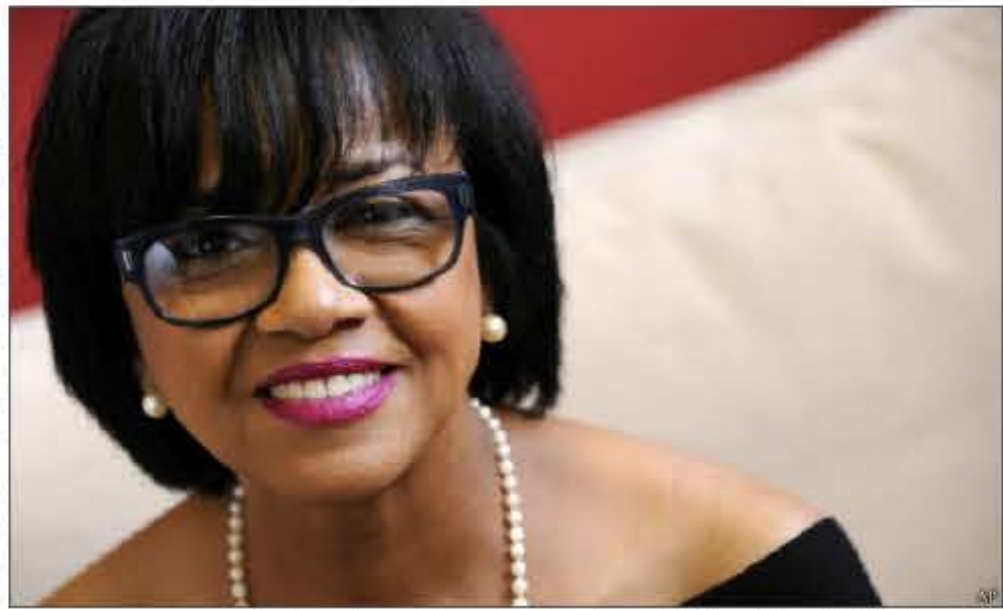
در پی انتقادهای از نبود تنوع نژادی و امسال، رئیس آکادمی علوم و هنرهای جنسیتی در معرفی نامزدهای اسکار سینمایی آمریکا گفت که ترجیح او هم

این است که شاهد تنوع بیشتری در نامزدها باشد، اما افزود این موضوع باید در سطح وسیع تری در کل صنعت سینماها مورد توجه قرار بگیرد. با وجود این شریل بون آیزاکس از معرفی نامزدهای امسال دفاع کرد و گفت که آکادمی پیشرفت خوبی در این زمینه داشته است. بیست نامزد معرفی شده در چهار رشته بازیگری امسال همگی سفیدپوست